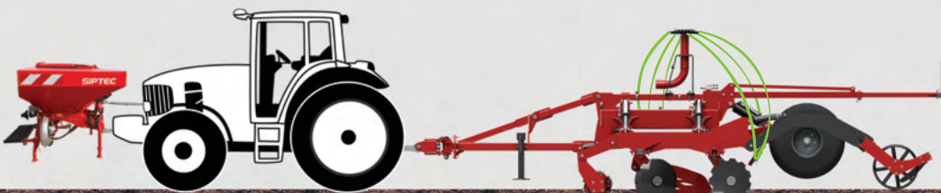
FDF 2000 + DiscoPlus