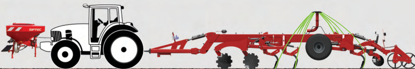
FDF 2000 + Master HD