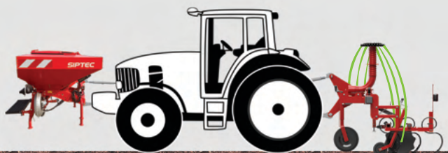
FDF 2000 + SKEN