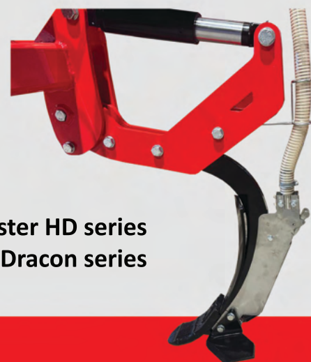
Master HD series Dracon series