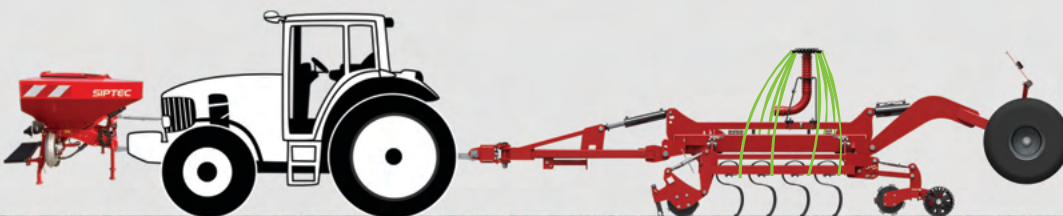
FDF 2000 + VibroPro