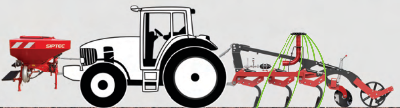
FDF 2000 + Dracon